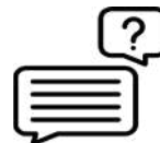
Banakako Erantzuna Contestación individualizada