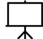
Erakusketako panelak Paneles expositivos