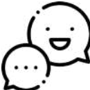
ETA ABAR. ETCÉTERA.