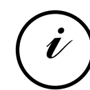
Informazio Puntua Punto de información