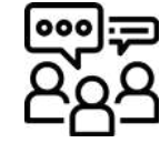
Taldeko elkarrizketak Entrevistas grupales