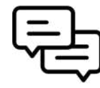
Banakako elkarrizketak Entrevistas individuales